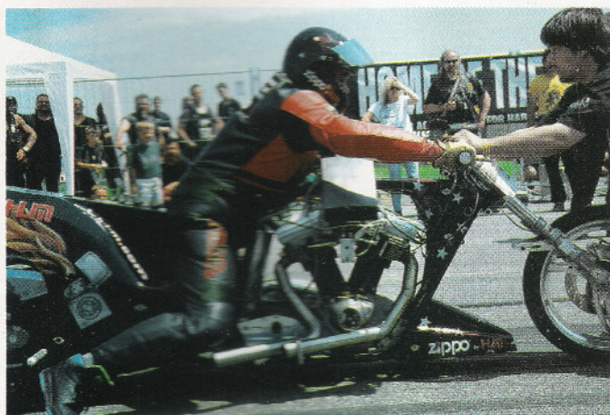
Immer sehr beliebt bei den Gästen: Dragster Vorführungen

Purer Spaß: man ist halt nie zu alt – wir kennen das ja